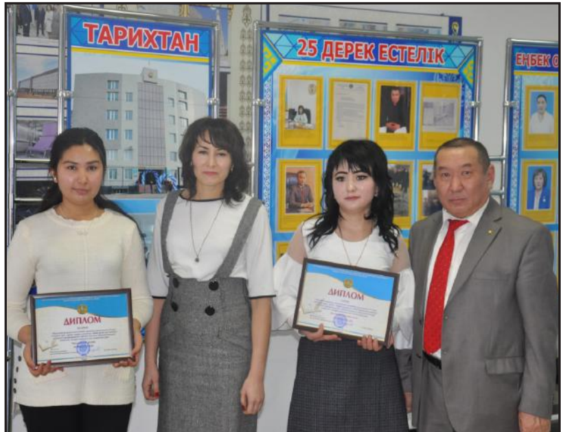
Суретте: ОҚПУ-дың жеңімпаз студенттері ғылыми жетекшілерімен бірге.

Байқауға қатысушы студенттер жұмысын бағалап, жеңімпаздарды анықтау үшін арнайы комиссия құрылды. Комиссия мүшелері студенттердің шығармашылық жұмыстарын жан-жақты талқылап, қорытындысын шығарып, жеңімпаздар әділетті жолмен анықталды.